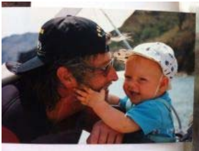
( https://goeldiontour.files.wordpress.com/2014/11/img_5600.jpg )