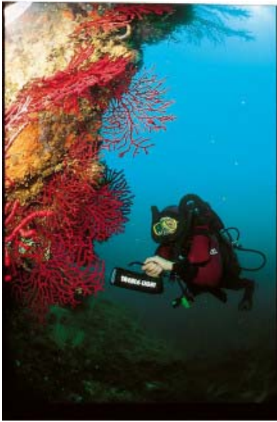
( https://goeldiontour.files.wordpress.com/2014/11/vgnorfeo.jpg )