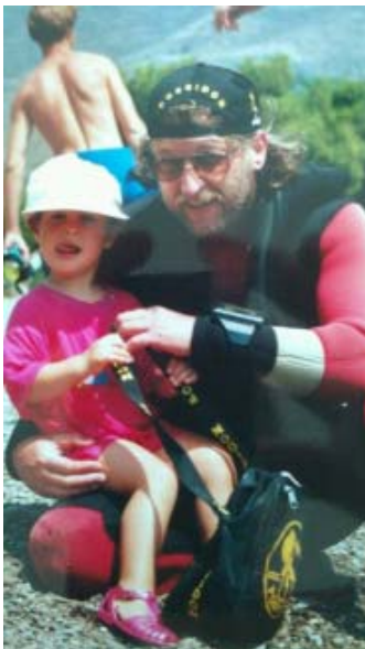
( https://goeldiontour.files.wordpress.com/2014/11/annaich.jpg )