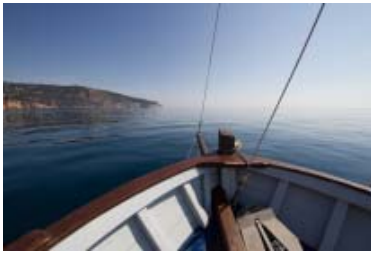
( https://goeldiontour.files.wordpress.com/2016/05/20150601-img_0193.jpg )