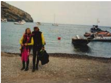
( https://goeldiontour.files.wordpress.com/2014/11/jule-und-ich.jpg )