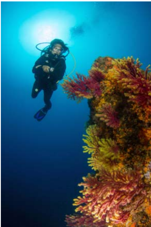
( https://goeldiontour.files.wordpress.com/2016/05/gorgonen.jpg )

Und wer einmal die Tamariu Canyons betachtet hat, weiss warum Tamariu seit ewigen Zeiten so viele Stammgäste hat! Denn sie sind neben dem Tamariu Hausriff, durch ihre exponierte Lage und dem dadurch unglaublichen Bewuchs mit Gorgonien, sowie ihrer Fischvielfalt, sicherlich eines der Highlights an der Costa Brava.